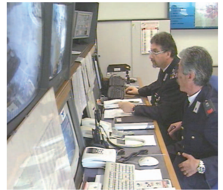
Da oggi nuovi «occhi» contrastano la microcriminalità