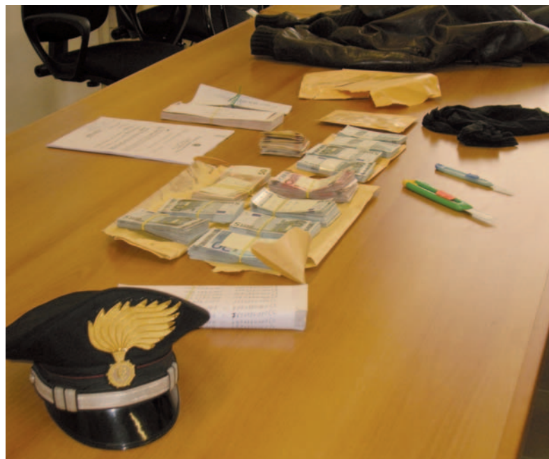
Il denaro e il materiale sequestrati dai carabinieri